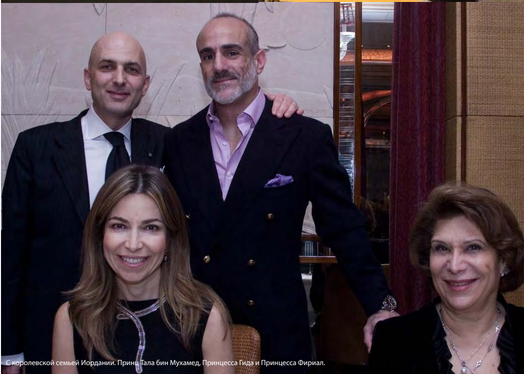
С королевской семьей Иордании. Принц Тала бин Мухамед, Принцесса Гида и Принцесса Фириал.