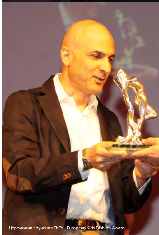
Церемония вручения EKFA - European Kids Fashion Award